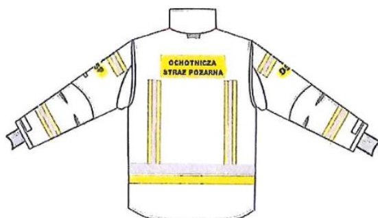
Przykładowy widok kurtki