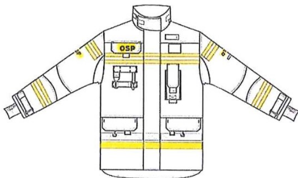
Przykładowy widok kurtki